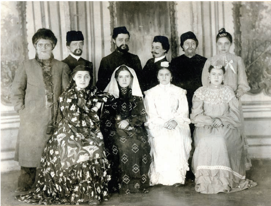
Казанда спектакльләрдә катнашкан зыялы кызлар труппасы