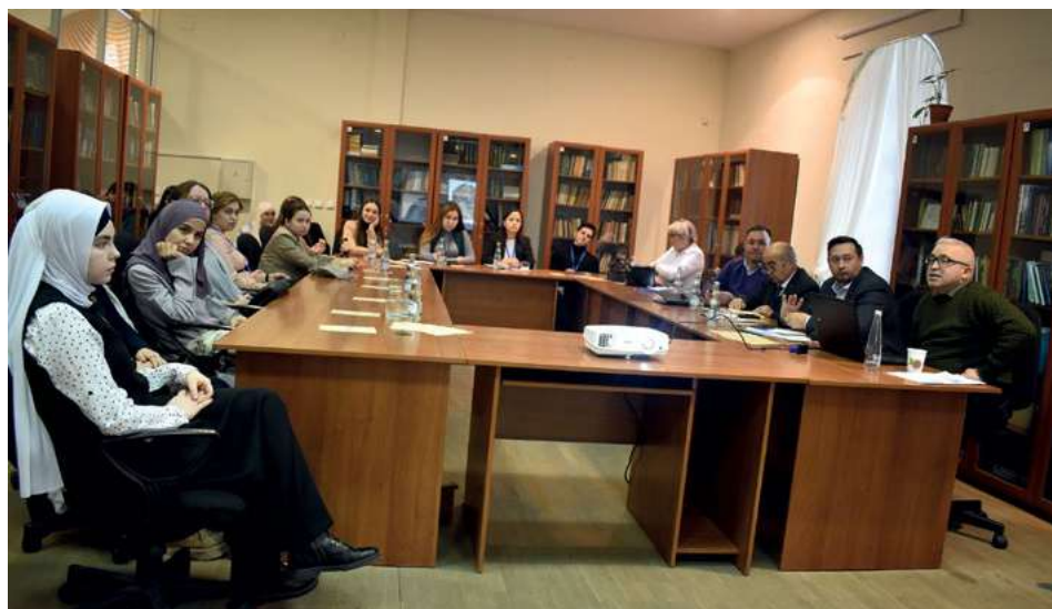
Татарстан Республикасы Фәннәр академиясенең Г. Ибраһимов исемдәге Тел, әдәбият һәм сәнгать институты тарафыннан ел саен уздырыла торган «Татар гыйлеми» Халыкара яшьләр фәнни мәктәбе эшеннән күренеш. 2022 ел, 7–9 декабрь