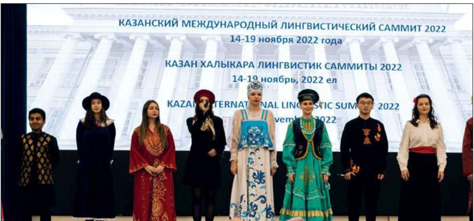
Казан федераль университетында III Казан халыкара лингвистик саммит ачылышы 2022 ел, 14 ноябрь