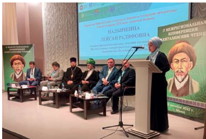
Мифтахетдин Акмулланың ижади мирасына багышланган II төбәкара конференция. Чиләбе өлкәсе Мияз шәһәре. 2022 ел, 26 октябрь