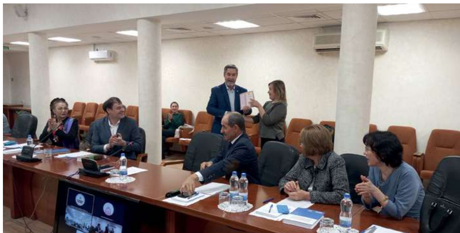
Татарстан Республикасы Фәннәр академиясе базасында фәннәр кандидаты һәм фәннәр докторы гыйльми дәрәжәсенә диссертацияләренә яклау буенча оештырылган Д 022.006.02 диссертация советы утырышында докторлык дипломын тапшыру. 2022 ел, 13 октябрь