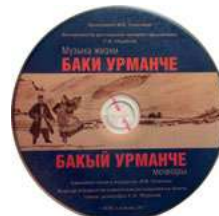
«Бакый Урманче моңнары» китабына аудиодиск