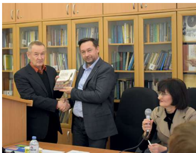
Татарстан Республикасы Фәннәр академиясе Г. Ибраһимов исемдәге Тел, әдәбият һәм сәнгать институтында «Хәзерге дөньяда традицион мәдәниятне саклау һәм үстерү тәҗрибәсе» дип аталган I Халыкара конференция. 2022 ел, 16 декабрь