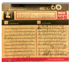
Б. Урманче башкаруындагы жырлар тулланган компакт-кассета