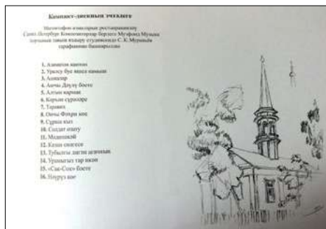
Китапның аудиодиск этәлегә күрсәтелгән бите