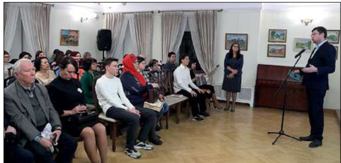
Галим һәм педагог Хужа Бәдигыйның тууына 135 ел тулуга багышланган «Тукайдан алган фатиха белән» кичәсе. Г. Тукайның Казандагы әдәби музее. 2022 ел, 10 ноябрь.