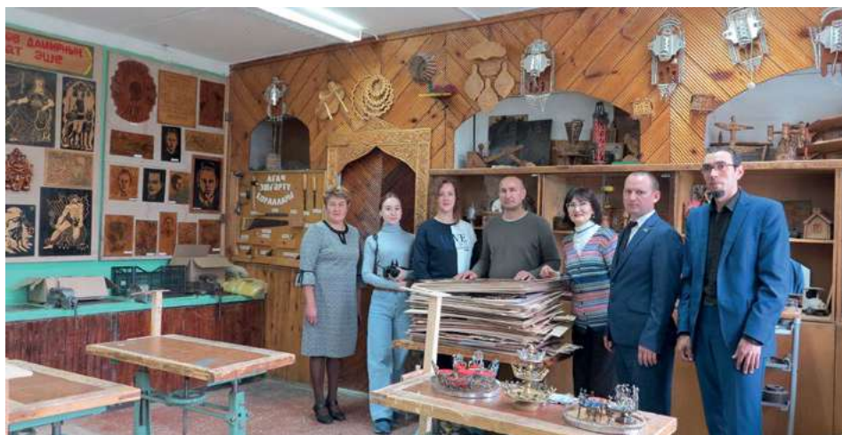
ТР ФА Г. Ибраһимов исемдәге Тел, әдәбият һәм сәнгать институтының Сәнгать белеме үзәге хезмәткәрләре Балтач районында фәнни экспедициядә. 2022 ел, октябрь